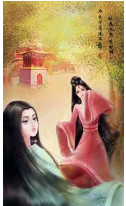
LE DUE PRINCIPESSE: DINASTIA HAN CAO DIANA SHUYING

Una particolare attenzione, anche, a tutti i medio-evi e rinascimenti non occidentali, come quello cinese, ad esempio, della Dinastia Han o giapponese, del periodo Edo, che hanno elaborato schemi concettuali, poetiche ed opere e manufatti artistici di altissima qualità, a cui possiamo ispirarci e con cui possiamo colloquiare, all'interno di uno scambio culturale locale e globale, per un tecno-umanesimo del XXI Secolo.