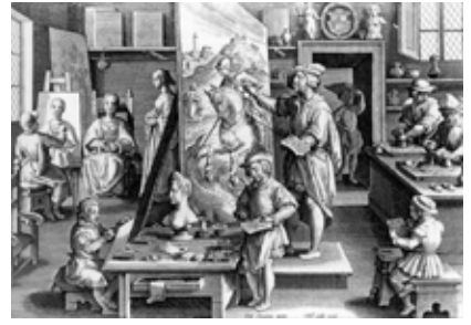
ARTISTI DEL RINASCIMENTO: LA BOTTEGA DI UN ARTISTA

Il nostro Tecno-Medio-Evo riprende questo tipo di laboriosità medio-evale come anche l'importazione di modelli artistici, presi dalle tecniche delle botteghe rinascimentali e il loro umanesimo e lo riadatta alla nostra epoca, dandoci opere, visioni, simbolismi, memorie, percezioni, configurazioni concettuali e artistiche che richiamano i grandi cicli artistici del passato, a confronto con quello che la nostra epoca e il nostro presente iper-tecnologico e virtuale, ci mette, tuttora, a disposizione.