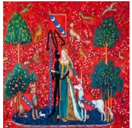
LA DAMA E L'UNICORNO, IL TATTO (IL CONIGLIO NERO)